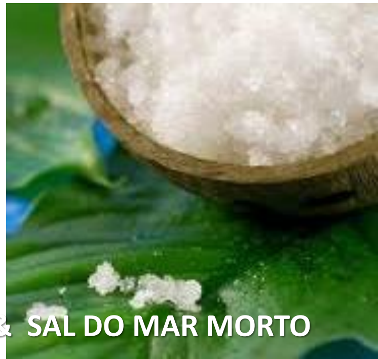
ÓLEO DE SEMENTE DE GERGELIM & SAL DO MAR MORTO