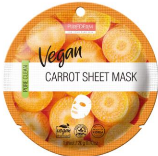
Máscara Facial Cenoura