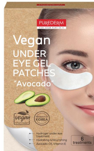
Patches Área dos Olhos - Abacate