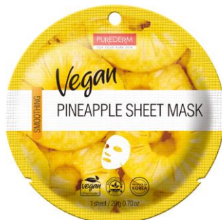
Máscara Facial Abacaxi