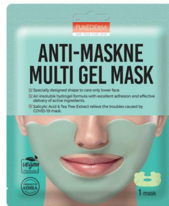
Máscara Facial Multi Gel