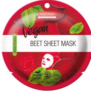
Máscara Facial Beterraba