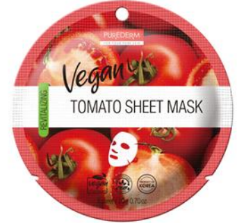
Máscara Facial Tomate