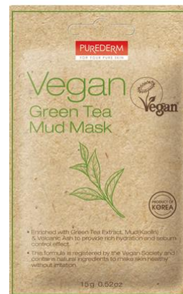
Máscara Facial Lama de Chá Verde