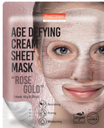
Máscara Facial Creme Redutor da Idade Ouro Rosa