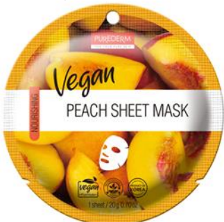
Máscara Facial Pêssego