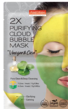
Máscara Facial Purificante Bolhas 2 EM 1 Vinagre e Cica