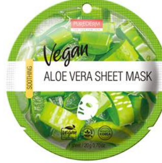
Máscara Facial Aloe Vera