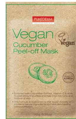
Máscara Facial Peel-off de Pepino