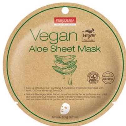
Máscara Facial Aloe