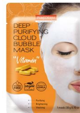
Máscara Facial Limpeza Profunda Bolhas Vitaminas