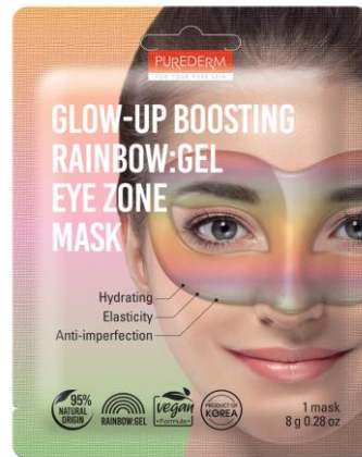
Máscara Área dos Olhos Gel aumento do Brilho Arco-Íris