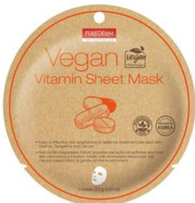
Máscara Facial Vitaminas