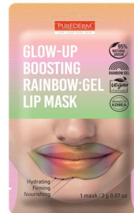
Máscara para Lábios Gel aumento do Brilho Arco-Íris