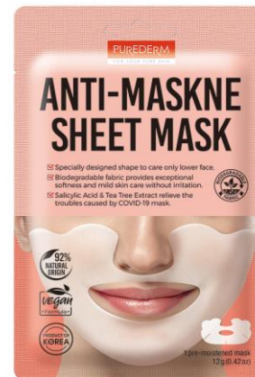
Máscara Facial Tecido