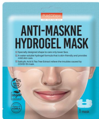
Máscara Facial Hidrogel