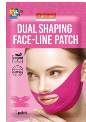
Patch Linha Facial com Formação Dupla