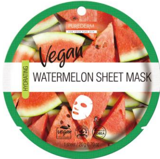
Máscara Facial Melância