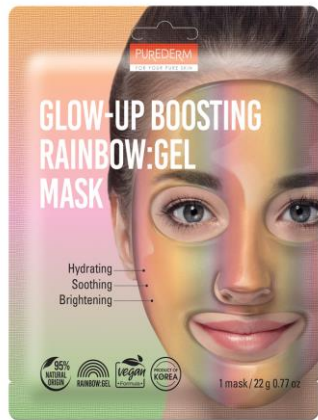
Máscara Facial Gel aumento do brilho Arco-Íris