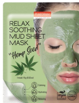
Máscara Facial Relaxante e Suavizante Lama Cânhamo