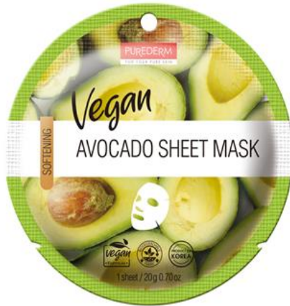
Máscara Facial Abacate