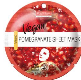
Máscara Facial Romã