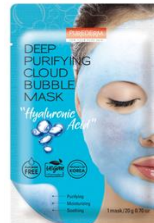
Máscara Facial Limpeza Profunda Bolhas Ácido Hialurônico