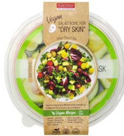
Máscara Facial Salada Bowl para Pele Seca