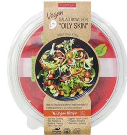
Máscara Facial Salada Bowl para Pele Oleosa