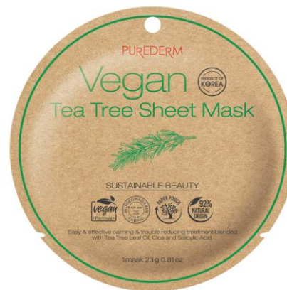
Máscara facial Ervas