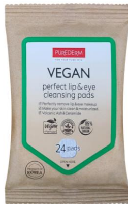
Pads de Limpeza Lábios e Olhos