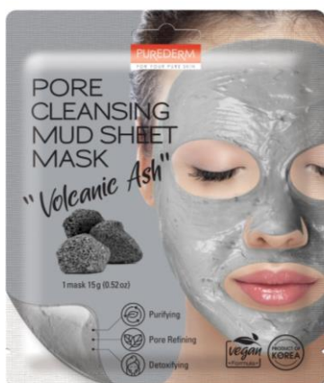
Máscara Facial Limpeza dos Poros Lama Vulcânica