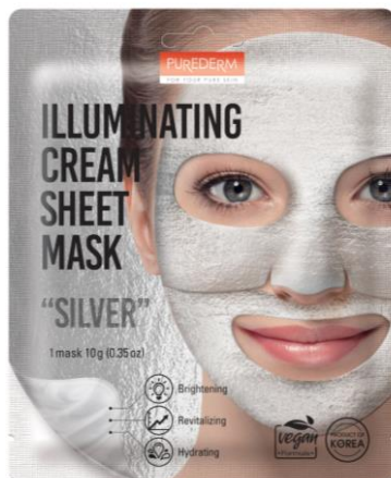
Máscara Facial Creme Iluminante Prata