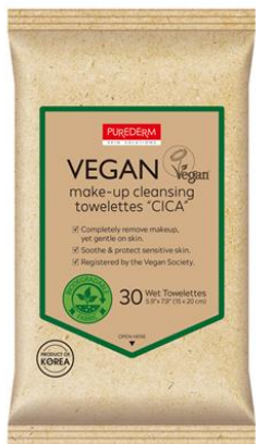
Lenços Demaquilantes Cica