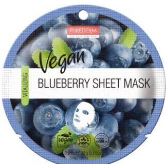
Máscara Facial Blueberry