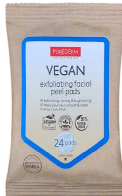
Pads Exfoliantes para Rosto