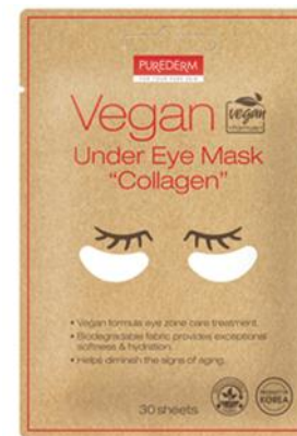
Pads para área dos Olhos de Colágeno