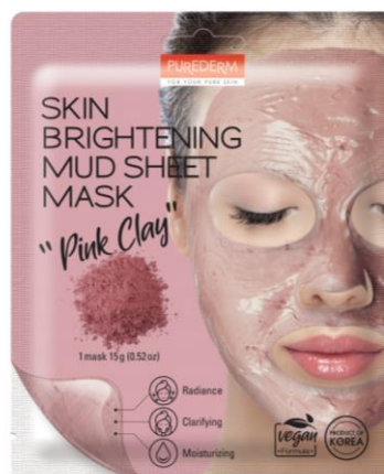
Máscara Facial Iluminadora da Pele Lama Cal Rosa