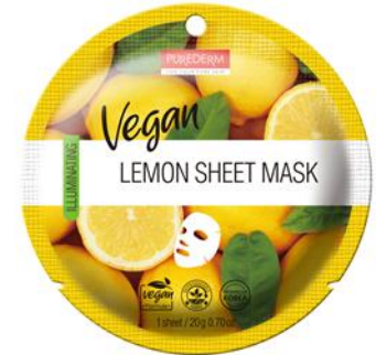
Máscara Facial Limão