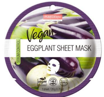
Máscara Facial Beringela