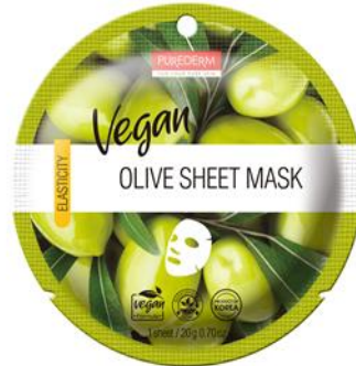
Máscara Facial Azeite de Oliva